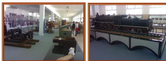
Fundação Museu Nacional Ferroviário – Entroncamento