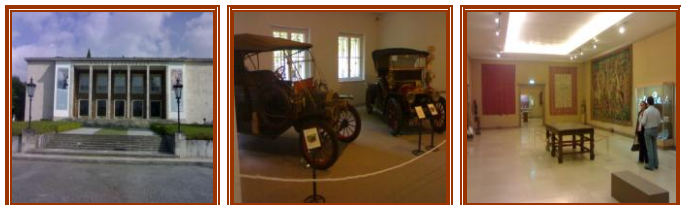
Museu do Caramulo

Portuguesa dos Museus e ainda diversos oradores ligados quer a Museus, quer a Grupos de Amigos de Museus. Todos os intervenientes, destacaram da necessidade de um maior entrosamento entre as Autarquias, os Museus e os seus Amigos, as Entidades Oficiais e os Empresários, numa perspectiva de uma consolidação turística sustentável a médio/longo prazo permitindo, assim, uma mais-valia para as nossas regiões. No encerramento, houve uma visita guiada ao Museu do Caramulo, seguido de um coktail no claustro, oferecido pelos Amigos do Museu do Caramulo.