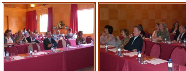
Assembleia Geral FAMP 2007 - Caramulo

Ponto 6. A Organização da Assembleia Geral Ordinária para 2008, será em Castelo Branco, com a organização da Sociedade dos Amigos do Museu de Francisco Tavares Proença Júnior, em colaboração com o respectivo Museu.