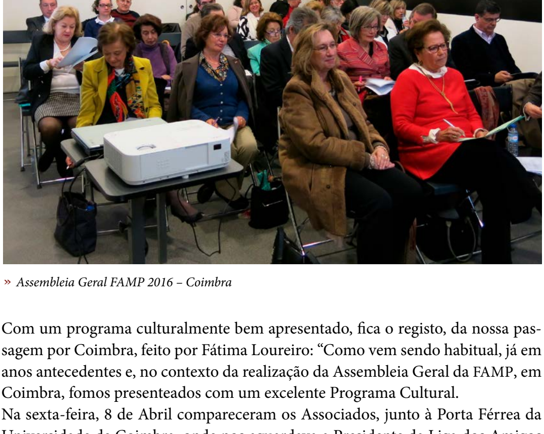
» Assembleia Geral FAMP 2016 – Coimbra

Com a presença dos nossos associados, realizou-se no passado dia 9 de abril, em Coimbra, a Assembleia Geral FAMP de 2016. Com organização da Liga de Amigos do Museu Nacional Machado de Castro e numa sala gentilmente cedida pelo respetivo Museu. Postos à votação os pontos em discussão, foram todos aprovados por unanimidade. De referir, as propostas em organizar a próxima AG da FAMP, em 2017, da parte dos amigos do museu da pólvora negra e dos amigos do museu de lamego.