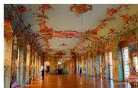
Berlim, grande centro cultural

que conta com três salas de ópera e inúmeras salas de teatro . Ainda no campo das