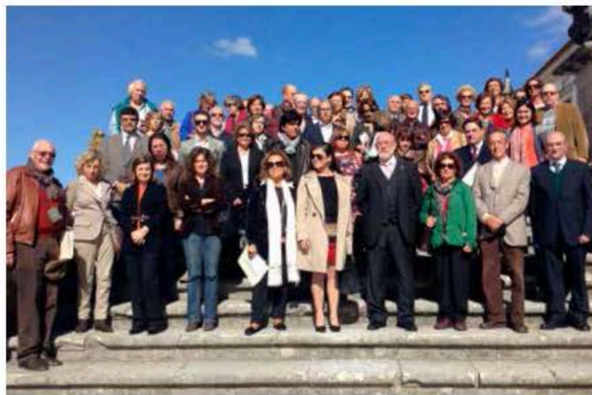
Encontro FAMP Alcobaça 2013