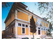
MUSEU NACIONAL DE ARTE ANTIGA

A celebrar o seu 1º centenário, os Amigos do Museu Nacional de Arte Antiga merecem, neste número, o destaque a algumas das atividades do seu Museu, desejando-se o maior sucesso, numa perspectiva de engrandecimento da museologia e das Associações/Grupos de Amigos dos Museus de Portugal.