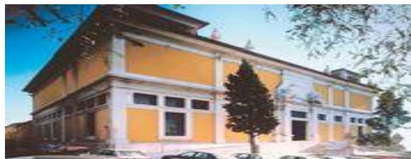
MUSEU NACIONAL DE ARTE ANTIGA