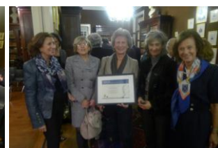
AMCaramulo 1ª Menção Honrosa