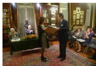
GAMNAA Prémio Prof. Reynaldo Santos