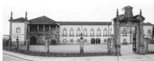
Museu Francisco Tavares Proença Júnior

Irá decorrer no próximo dia 5 de Abril, em Castelo Branco, no Museu Francisco Tavares Proença Júnior, numa Organização da FAMP e da Sociedade dos Amigos do Museu - SAMFTPJ -, a Assembleia Geral da FAMP/2008. Em paralelo à Assembleia Geral decorrerá um Programa Cultural da responsabilidade da Sociedade dos Amigos do Museu Francisco Tavares Proença Júnior, do qual constará: